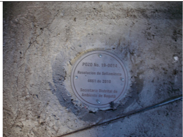
Fotografía 2. Placa de sellamiento definitivo, Resolución No. 4661 de 2010

De acuerdo con los antecedentes registrados en el Expediente, la Resolución No. 1323 del 28/06/2000, otorga concesión para la explotación del agua subterránea hasta por una cantidad de 1350 litros diarios, con un tiempo de bombeo diario de 45 minutos, a la Industria Curtiembres El Cóndor, por un periodo de cinco (5) años. Posteriormente, a través de los Memorandos No. 2231 del 09/09/20003, No. 2772 del 09/12/2003 y No. 534 del 09/03/2004 se reporta un sobreconsumo de 12 trimestres correspondientes al término transcurrido entre el segundo trimestre del 2000 y el cuarto del 2003. Así, la Resolución No. 479 del 07/05/2004, resuelve imponer medida preventiva de suspensión de las actividades que impliquen el uso del agua captada y por el Auto No. 777 del 17/05/2004, se dispone formular pliego de cargos a la firma, por usar y aprovechar aguas subterráneas superando los niveles de consumos otorgados por la resolución de concesión.