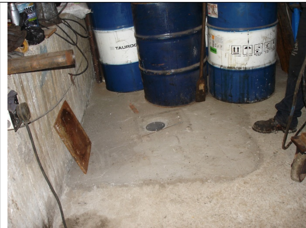
Fotografía 1. Estado actual del pozo pz-19-0014

De acuerdo a lo anterior, el usuario envió mediante el radicado 2013ER102649 del 12/08/2013, el informe de las actividades realizadas durante el 31/07/2013, día en el que se efectuó el sellamiento definitivo a este pozo y su respectivo registro fotográfico.